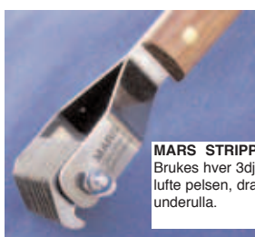
MARS STRIPPE-KARRE Nr 520 Brukes hver 3dje uke for å tynne og lufte pelsen, dra ut dødhår fra underulla.