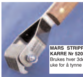
MARS STRIPPEKARRE Nr 520 Brukes hver 3de uke for å tynne og