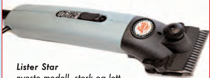
Lister Star nyeste modell, sterk og lett.

BLANKET-KLIPP kalles det når vi etterlater et dekkenformet felt på kroppen for å holde flankene varme. Bare nakken og magen klippes. Dette er en god klippform for hester i moderat aktivitet.