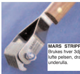
MARS STRIPPE-KARRE Nr 520 Brukes hver 3dje uke for å tynne og lufte pelsen, dra ut dødhår fra underulla.