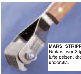
MARS STRIPPE-KARRE Nr 520 Brukes hver 3dje uke for å tynne og lufte pelsen, dra ut dødhår fra underulla.